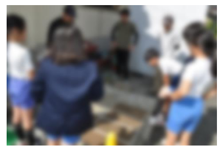
③ 苗床の管理に向けた説明