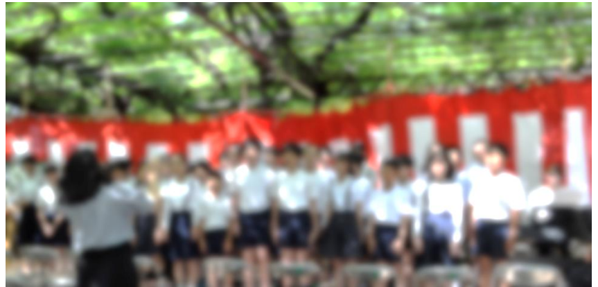
團伊玖磨碑の前で、一人ひとりの歌声を響かせました。