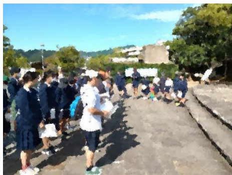
↑ 平和公園で行った平和集会の様子

10月13日(金)～14日(土)に、6年生は修学旅行に行きました。天気にも恵まれ、1泊2日の長崎への楽しい旅になりました。1日目は原爆資料館見学などの平和学習、2日目は長崎市内の班別フィールドワークを行いました。子どもたちは、ボランティアガイドさんの話を真剣に聞いたり計画した場所をじっくり見学したりして、とてもいい学習ができました。宿泊地のアイランド長崎では、おいしい食事をたくさん食べ気もちよく過ごしました。思い出に残る修学旅行になりました。