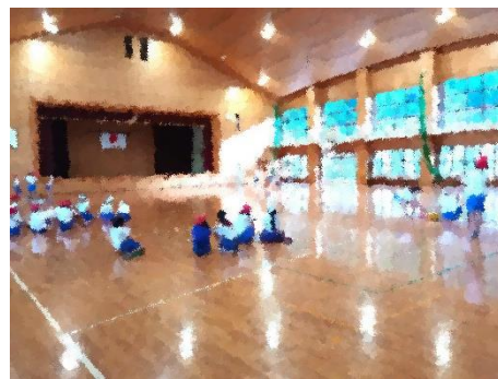
↑ レクリエーションを楽しむ子どもたち げんき館おおぶちの体育館にて