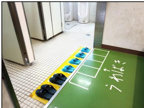
↑ トイレのスリッパがきれいに並んでいる。

左の写真は、ある日の低学年のトイレです。きれ いに、スリッパが並んでいました。並んでいるスリ ッパを見ると、いろんなところに気遣いができる子 がいてうれしいなと思います。次に使う人が使いや すいようにと、しゃがんでいねいに並べてくれて いる姿が思い浮かびます。わくの黄色い線からは み出ないように気をつけて並べたのでしょう。人の 気持ちを考えて行動できる子どもが、ますます増 えていくことと思います。