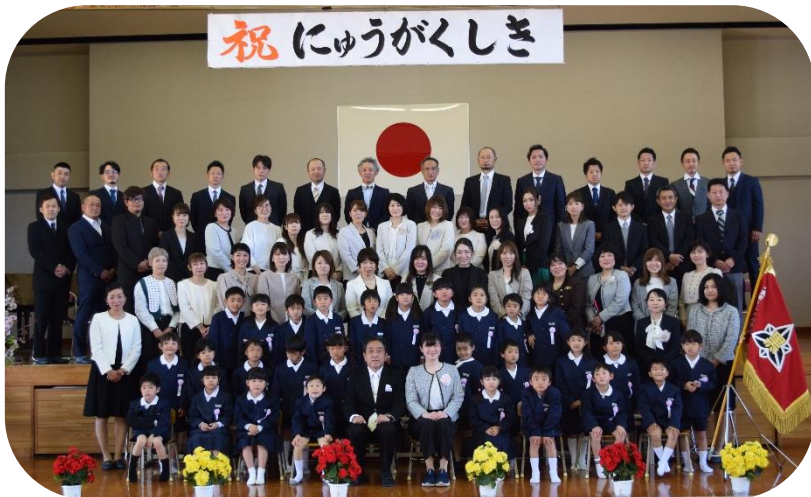
【1年生 28名】「おめでとう」