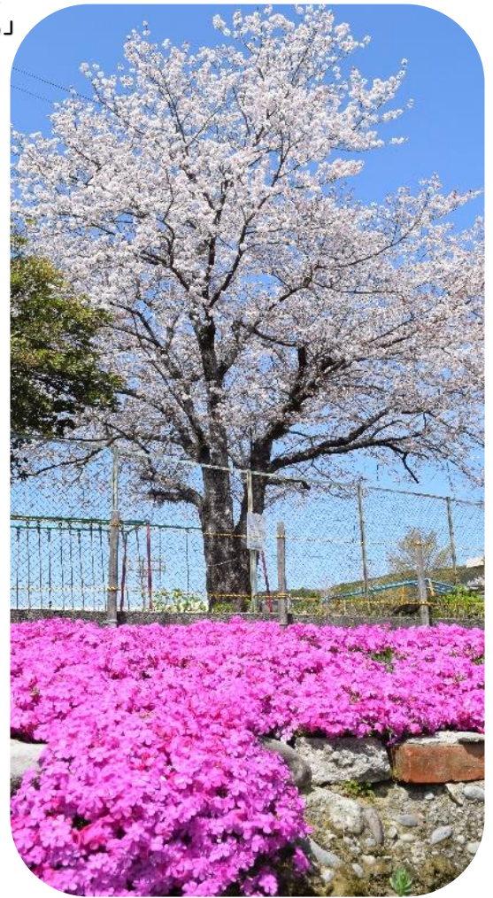
【4月1日撮影「芝桜とサクラ」】

あ..あいさつ あ..ありがとう あ..あんぜん あ..あとしまつ の4つです。